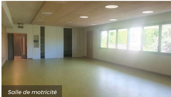
Salle de motricité

La salle de motricité est également un gros progrès, elle permettra de nombreuses activités aux classes de maternelle qui n'auront plus besoin de se déplacer à l'Oppidum et seront au chaud l'hiver.