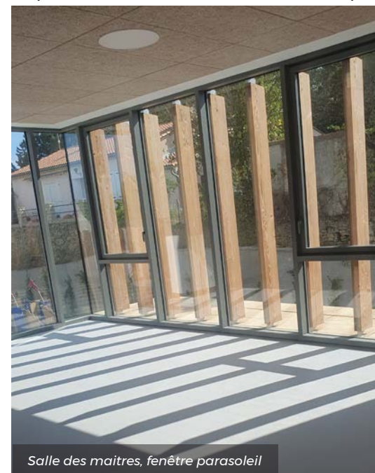
Salle des maîtres, fenêtre parasoleil

Tout est étudié, les fenêtres sont biseautées, pour empêcher les rayons de pénétrer l'été, les puits de lumière sont orientés plein